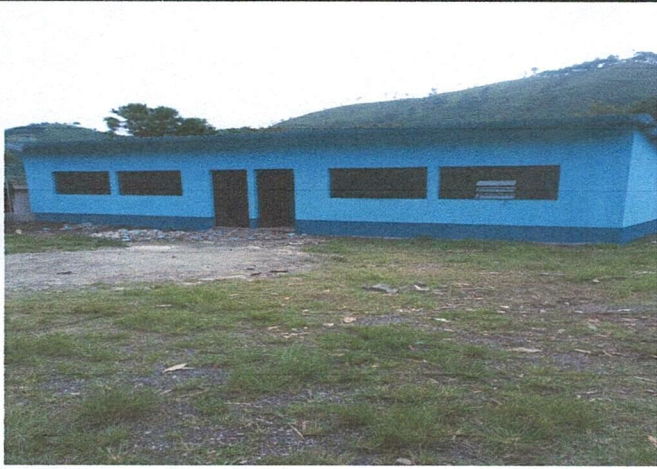
Foto1: Mejoramiento modulo aula tipo Porticó con cubierta de lámina troquelada calibre 26, piso tipo torta ventanas, puertas pintura interior y exterior, estructura de techo metalico.